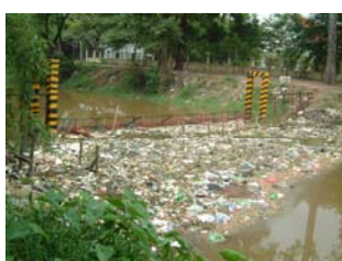
សំរាមនៅតាមដងស្ទឹងសៀមរាប (៤មិថុនា២០០៣)

តាមរយៈការចុះទៅអង្កេតផ្ទាល់នូវស្ថានភាពសំរាម តាមដងស្ទឹងសៀមរាប និងក្នុងឧទ្យានអង្គរនាពេលនោះ យើងសង្កេតឃើញមានសំរាមជាច្រើនកន្លែងដែលនៅពុំទាន់មានវិធានការចាត់ចែងទៅឡើយ។