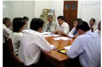
ការប្រជុំពិភាក្សា រវាងថ្នាក់ដឹកនាំនៃអាជ្ញាធរអប្សរា (១៥កញ្ញា២០០៣)

ការពិគ្រោះពិភាក្សា រវាងថ្នាក់ដឹកនាំនៃអាជ្ញាធរអប្សរា ស្តីពីការបង្កើតរចនាសម្ព័ន្ធ ព្រមជាមួយកិច្ចការចាំបាច់សំរាប់គ្រប់គ្រងបរិស្ថានអង្គរ បានប្រព្រឹត្តឡើងនៅលើកទី១ ថ្ងៃទី២៥ ខែឧសភា ឆ្នាំ២០០៣ និងលើកទី២ ថ្ងៃទី១៥ ខែកញ្ញា ឆ្នាំ២០០៣ ។