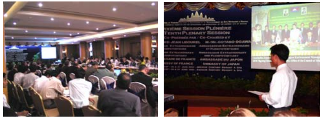
ការពន្យល់បង្ហាញអំពីគំរោង ចំពោះអង្គប្រជុំICC (២៧មិថុនា២០០៣)

ការបង្ហាញគំរោងប្រព័ន្ធគ្រប់គ្រងបរិស្ថានអង្គរ នៅក្នុងសម័យប្រជុំពេញអង្គលើកទី១០ នៃគណៈកម្មការអន្តរជាតិសម្របសម្រួលការការពារនិងអភិវឌ្ឍន៍ តំបន់ប្រវត្តិសាស្ត្រអង្គរ (ICC) ។