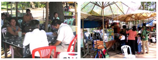
សកម្មភាពសម្ភាសអ្នកលក់នៅអង្គរវត្ត និងបរិវេណអង្គរធំ (២២សីហា២០០៣)

ការរៀបចំសំនួរដើម្បីសម្ភាស អ្នកលក់ដូរនៅក្នុងឧទ្យានអង្គរ ស្តីពីប្រភព ប្រភេទ និងបរិមាណនៃសំណល់ ក្នុងគោលបំណងបង្កើតគោលដៅ និងកម្មវិធីគ្រប់គ្រងសំណល់នៅឧទ្យានអង្គរ ។