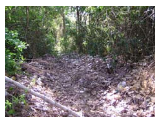
សំរាមនៅតាមព្រៃភ្នំព្រៃសាទ (២០កក្កដា២០០៣)