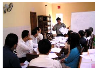
ការប្រជុំអ្នកជំរុញការងារបរិស្ថានប្រចាំនាយកដ្ឋាននីមួយៗរៀនរាល់ព្រឹកថ្ងៃសុក្រ

៥២តុលា២០០៣ ពិភាក្សាគោលបំណងនិងគោលដៅបរិស្ថានប្រចាំនាយកដ្ឋាននីមួយៗ និងបកស្រាយស្តង់ដារ ។