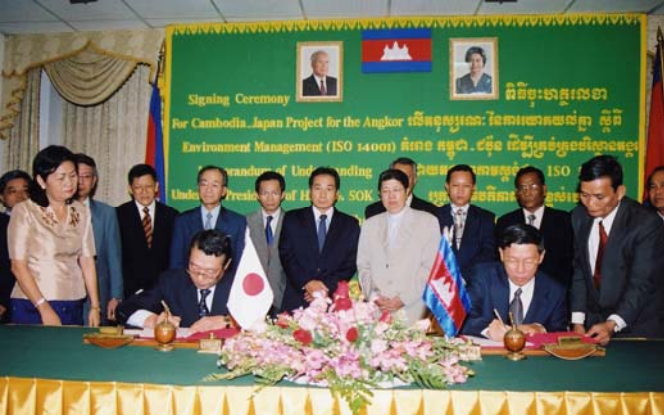
ពិធីចុះហត្ថលេខាលើអនុស្សរណៈនៃការយោគយល់គ្នា ស្តីពី "គំរោង កម្ពុជា-ជប៉ុន ដើម្បីគ្រប់គ្រងបរិស្ថានអង្គរ" នៅទីស្តីការគណៈរដ្ឋមន្ត្រី ថ្ងៃទី២៣ខែឧសភាឆ្នាំ២០០៣ ។